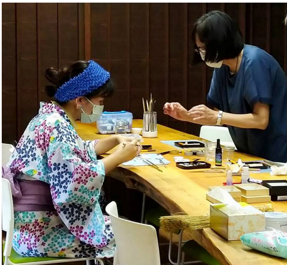
タイルイヤリング ワークショップ

永年にわたり高い技術と文化が受け継がれてきた日本の伝統工芸の魅力を広く知っていただくため、気軽に伝統工芸を体験できる機会として有松絞りの香り袋づくり、金箔・銀箔を利用したタイルイヤリングづくりは、子どもから大人まで楽しんでもらうことができた。