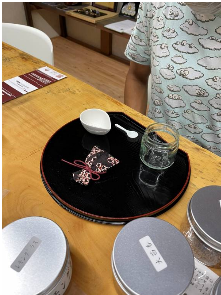
有松絞りの香り袋 ワークショップ