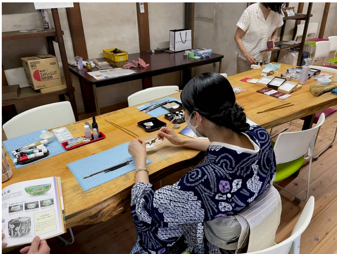
タイルイヤリング ワークショップ